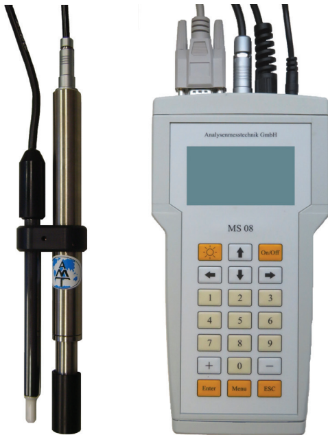
Système multiparamètres Adapter aux micro-capteurs H 2 S - H 2 - H 2 O 2 - O 2 - O 3

Instrument de mesure portable et de laboratoire